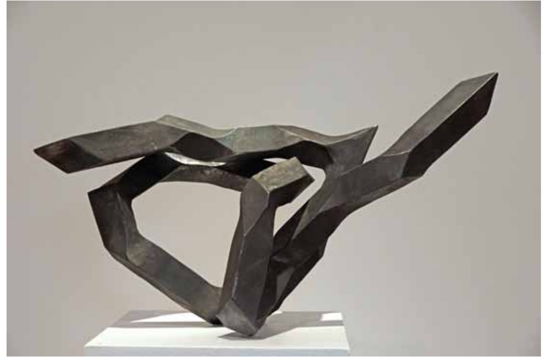
Robert Schad "SGIM" acier massif 45mm 65x36x19 cm Sans titre, acier massif