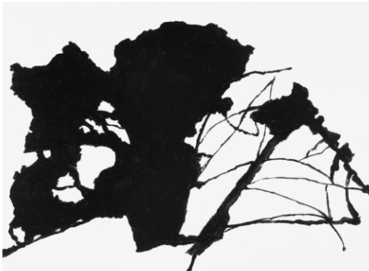
Alexandre Hollan "Chêne du Languedoc", 2 acryliques sur toile, 73x100cm, 2010