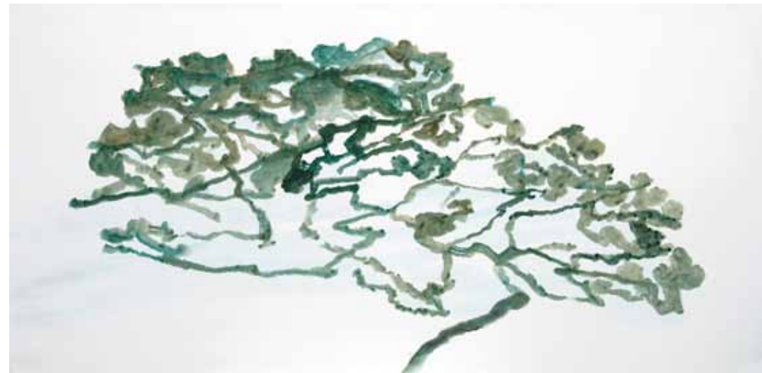
Alexandre Hollan Sans titre, acrylique sur toile, 195x130, 2011 Sans titre, acrylique sur toile, 98x195cm, 2009 Page suivante Sans titre, acrylique sur toile, 195x130, 2011